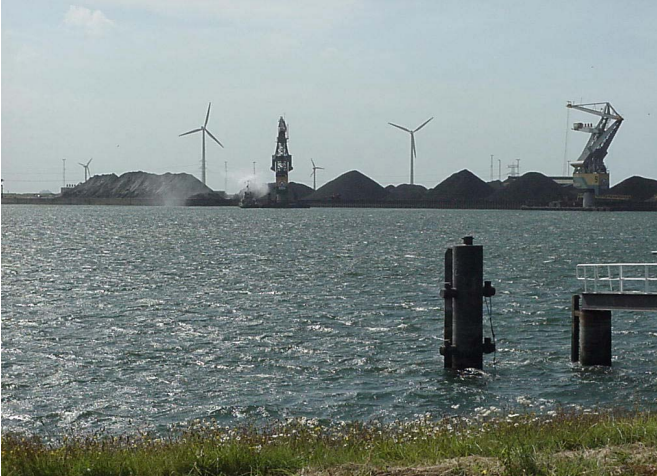
De kwaliteit van ons oppervlaktewater wordt geregeld in de Wet verontreiniging oppervlaktewateren.