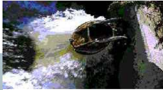
Heffing: De vervuiler betaalt